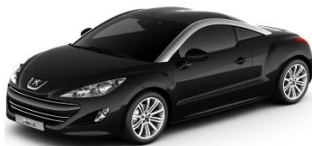
Noir Perla Nera