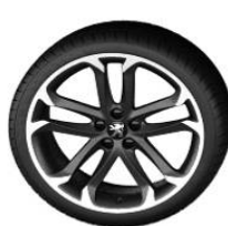
Solstice 19" Mat Black Onyx