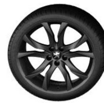
Sortilège 19" Mat Black Onyx