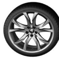
Sortilège 19" Midnight Silver