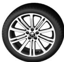
Original 18" Dark Grey