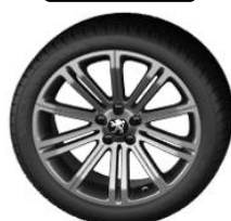
Original 18" Full Pirit Grey